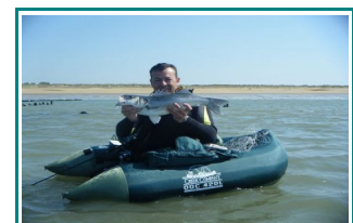
(1) Float tube:

La pratique de la pêche peut se faire avec un kayak non homologué (= engin de plage) au même titre qu'un float-tube(1), avec un équipement moindre, une canne à pêche et quelques leurres mais le pratiquant doit se limiter en distance à seulement 300 mètres de la côte. Elle peut aussi se faire avec un kayak homologué et immatriculé aux affaires maritimes avec des règles à respecter.